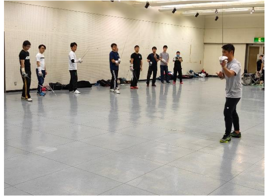
フットワーク等の実技講習

2日目は、簡単なウォーミングアップからフットワークなど、実技講習を行いました。基本的なフットワークやサーブル種目として大切なフットワークについて、実技を織り交ぜて指導していただきました。昨日の動画によるルール解説の中で登場したフットワークについても実技で取り上げられ、より具体的な使用の場面をイメージすることができました。また、サーブル独特のポジションについて番号をつけて学びました。サーブルにおけるパラードの必要性や戦術的な意味合いなども合わせて講義していただきました。