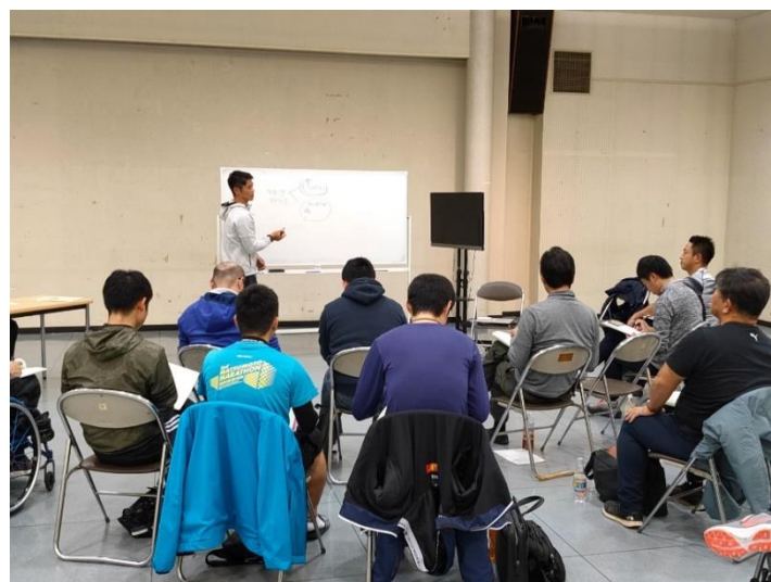
フェンシングに関する講義・ルール解説の様子

初日は講義としました。ボードを使用してフェンシングの体系など基本的な講義をしていただき、準備していただいた動画を視聴しながらサーブルのルール解説も受けました。2 日目から行う実技講習への足掛かりとなるサーブルのロジックを学ばせてもらいました。多くの参加者からは、今まで考えたことのなかった論理であり、大きな学びになったという感想が寄せられました。