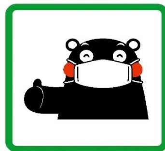
マスクをするモン #Wear a Mask